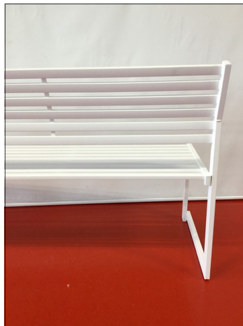
Vista da dietro