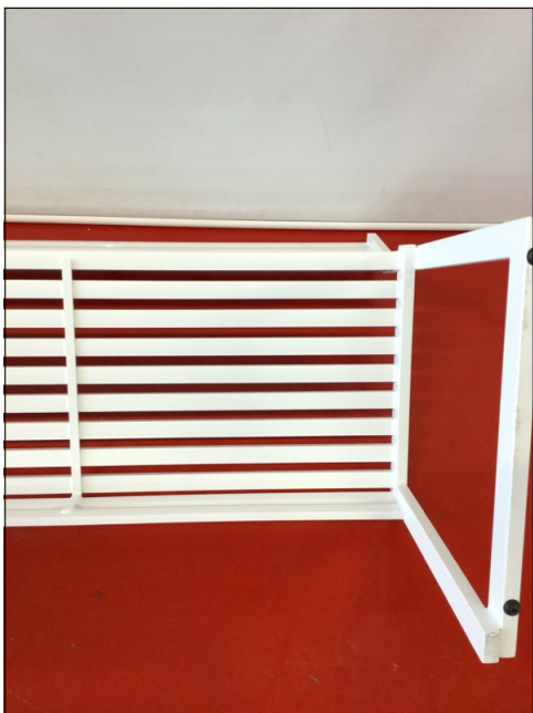
Vista da sotto

La denominazione e l'eventuale descrizione del campione sono dichiarate dal cliente; il CATAS non s'impegna a verificarne la veridicità. I risultati riportati sul rapporto di prova si riferiscono solo al campione provato. Aggiunte, cancellazioni o alterazioni non sono ammesse. Il rapporto di prova non può essere riprodotto parzialmente. Se non diversamente previsto da norme, specifiche tecniche o accordi con il cliente le eventuali dichiarazioni di conformità formulate dal CATAS si basano sul confronto tra i risultati ed i valori di riferimento senza considerare l'intervallo di confidenza della misura. Salvo diversa indicazione, il campionamento è stato effettuato dal cliente: in tal caso i risultati ottenuti si considerano riferiti al campione così ricevuto.