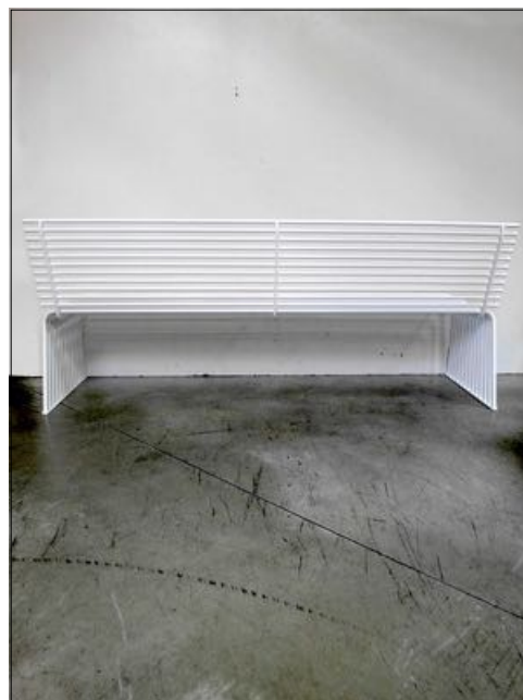
Vista da dietro