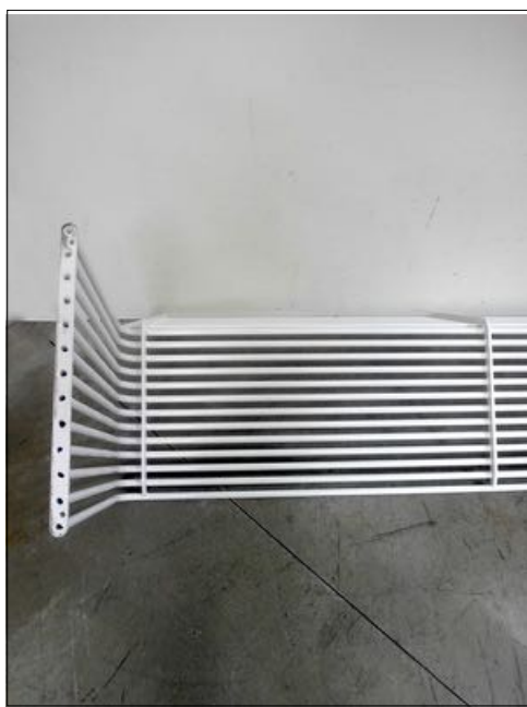
Vista da sotto