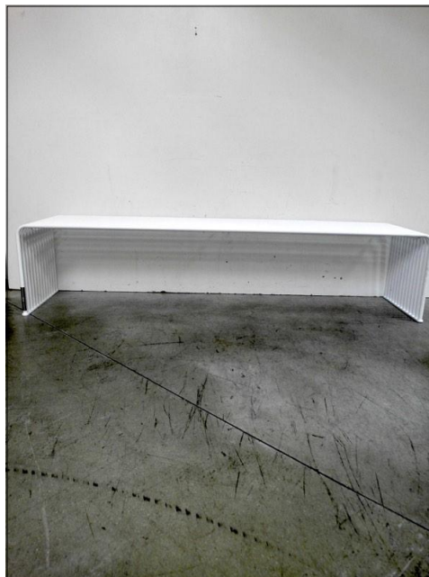
Vista da dietro