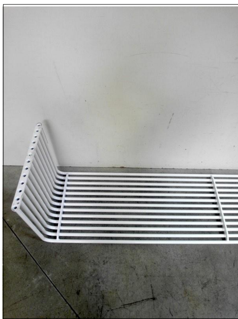
Vista da sotto