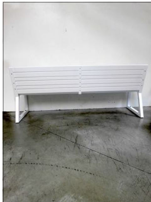
Vista da dietro