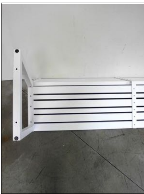
Vista da sotto

La denominazione e l'eventuale descrizione del campione sono dichiarate dal cliente; il CATAS non s'impegna a verificarne la veridicità. I risultati riportati sul rapporto di prova si riferiscono solo al campione provato. Aggiunte, cancellazioni o alterazioni non sono ammesse. Il rapporto di prova non può essere riprodotto parzialmente. Salvo diversa indicazione, il campionamento è stato effettuato dal cliente.